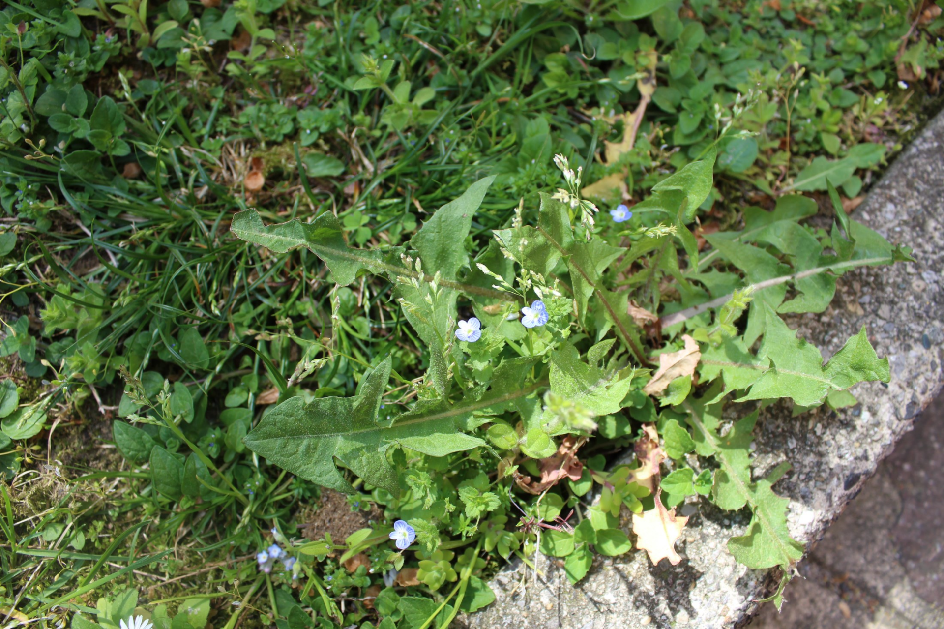
Alle leggiadre veroniche conosciute come “occhi della Madonna” Veronica persica