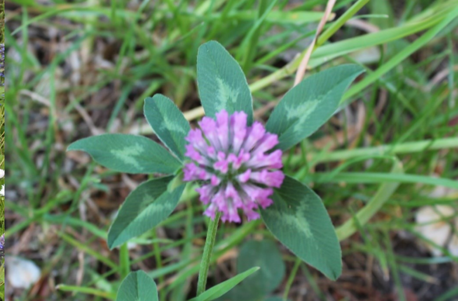
Trifoglio dei prati